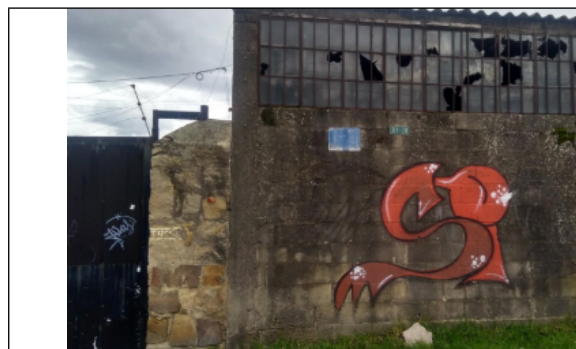
Foto No.1. Frente de la empresa RECONSTRUCTORA DE ENVASES S.A - (Tomada el día 24 de octubre de 2019)

Por otra parte, se intentó contactar vía telefónica a la casa matriz de la empresa en Cali, con la información de contacto que aparece en el RUES, pero al parecer los teléfonos ya no corresponden a la empresa, REDENVASES S.A.S., ya que la persona que respondió la llamada, informo que la empresa en cuestión dejó de operar en la dirección en Cali que aparecía en los registros de Cámara y Comercio (ver foto 9). Teniendo en cuenta lo anterior, se precisa que el usuario, RECONSTRUCTORA DE ENVASES S.A sucursal Bogotá, con N.I.T. 805.023.464-3, no se encuentra desarrollando un proceso industrial ni actividades administrativas en el predio ubicado en la Calle 59 A Bis A Sur No. 81 D – 20, en la localidad de Bosa de Bogotá.