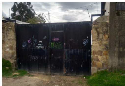
Foto No.2. Portón de entrada de la empresa